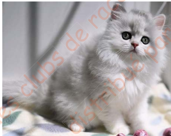
Figure 16. British longhair black"sunshine" de type "silver-type sunshine"

Noter la quasi-disparition du pigment eumélanine de la robe, la pâleur du pigment phéomélanine, le ventre et l'intérieur des membres blanchis et la persistance de la pointe de la queue noire. Le chat présente une modification de type "pink-sunshine".