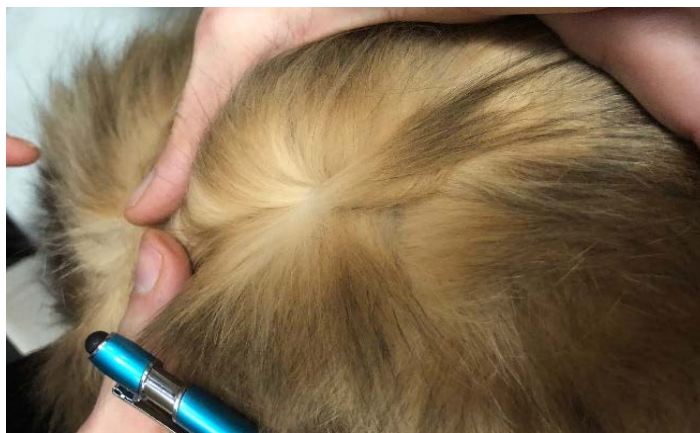
Figure 9. Base du pelage d'un Sibérien black (brown) sunshine tabby Noter la disparition de la base grise au profit d'une large bande jaune.