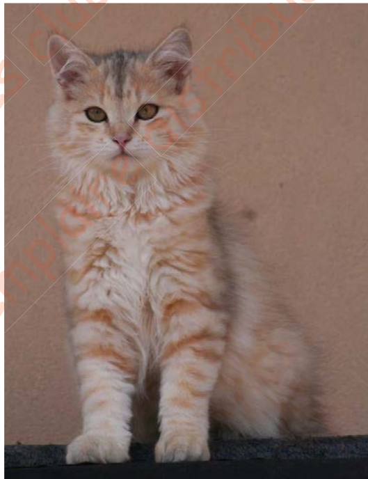
Figure 12. Jeune chatte Sibérien black silver sunshine tabby (bimétal)

Lorsqu'un chat est sunshine ou extreme-sunshine et qu'en plus il porte la mutation Silver (allèle / dominant), on observe une combinaison des modifications sunshine et silver appelée bimétal. Les poils silver sont plutôt visibles sur le dos et les poils sunshine sur le ventre, donnant une impression de délimitation dorso-ventrale des deux teintes argentée et dorée (Figure 12). Cette délimitation est surtout visible chez les jeunes chats et tend à s'estomper chez les chats matures.