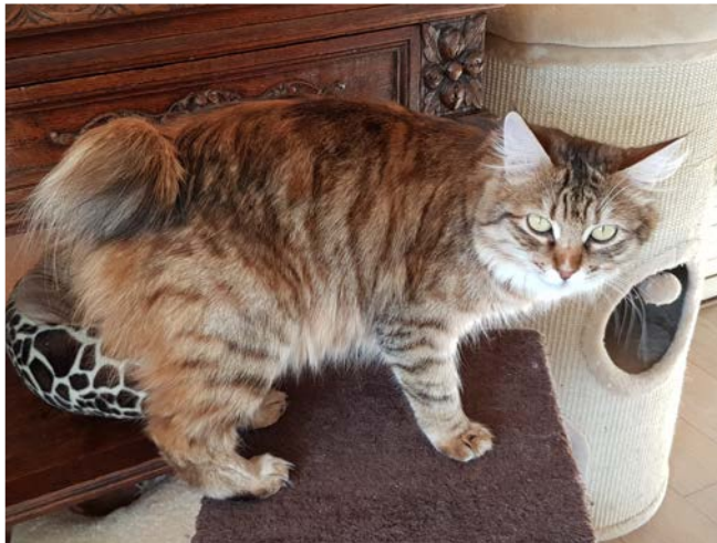
Figure 5. Chat black (brown) copal mackerel tabby. Femelle Kurilian Bobtail.

La deuxième modification, appelée carnelian, fait évoluer le patron brown tabby d'un chaton en un patron ressemblant à un red tabby à l'âge adulte (Figure 6).