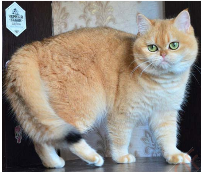
Figure 13. British shorthair black copper tabby

Noter la quasi-disparition du pigment noir de la robe, le ventre et l'intérieur des membres très éclaircis, les pieds présentant des éclaircissements crème caractéristiques et la pointe de la queue noire.