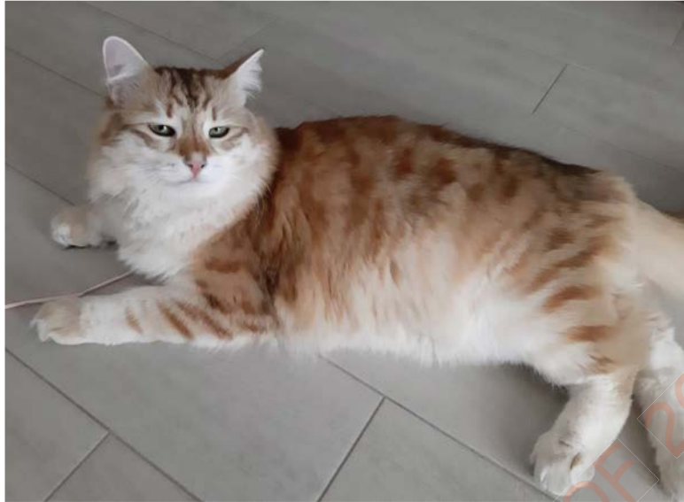
Figure 11. Chat Sibérien black (brown) extreme-sunshine tabby

Noter l'éclaircissement très marqué de la robe, le ton très blond du dos et presque blanc du ventre et de l'intérieur des membres.