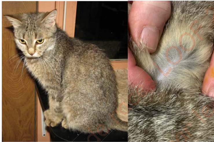
Figure 1. Chat agouti (brown tabby)

Chez le chat, il est admis que la couleur sauvage (originelle) est l'agouti (ou brown tabby en félinotechnie), caractérisée par la présence de poils agoutis et une couleur noire du pigment foncé (Figures 1 et 2). Deux types de pigments sont présents dans un poil agouti : le pigment noir (appelé eumélanine) et le pigment jaune (appelé phéomélanine).