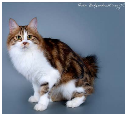
Figure 4 : Chat black (brown) copal blotched tabby et blanc Femelle Kurilian Bobtail, chaton (A) et adulte (B).