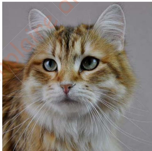
Figure 8. Tête d'un Sibérien black (brown) sunshine tabby