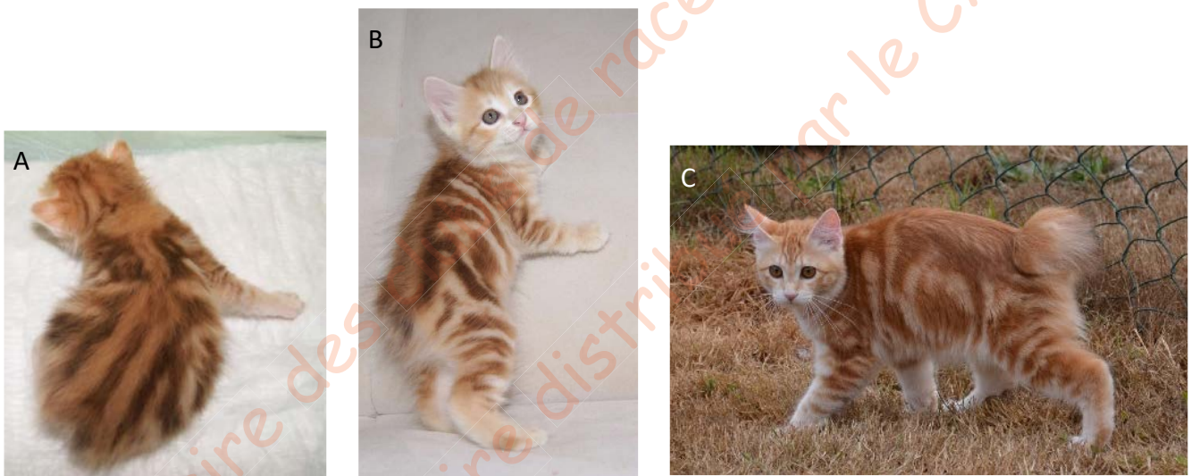
Figure 6. Chat black (brown) carnelian blotched tabby

La deuxième modification, appelée carnelian, fait évoluer le patron brown tabby d'un chaton en un patron ressemblant à un red tabby à l'âge adulte (Figure 6).