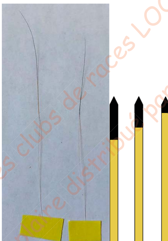
Figure 10. Photo et schéma de poils sunshine

La base est jaune et l'eumélanine a été repoussée à la pointe du poil.