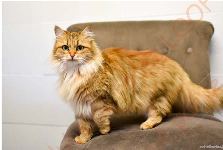
Figure 7. Femelle Sibérien black (brown) sunshine tabby

Les chatons naissent avec une couleur de base brown tabby. La couleur est évolutive. On observe un éclaircissement de la robe plus ou moins marqué avec l'âge, transformant le marquage tabby noir en brun-clair à orangé (Figure 7). Les chats sunshine présentent une décoloration blanche autour du nez et de la bouche, s'étendant généralement jusqu'au plastron, ainsi qu'un triangle éclairci au-dessus du nez. La truffe est rose, avec une perte du liseré eumélanique (Figure 8). La base du poil est entre un jaune (blond) et beige pâle (noisette, Figure 9). Les poils présentent une bande de phéomélanine allongée et une pointe d'eumélanine, caractéristique des poils tipped (Figure 10).