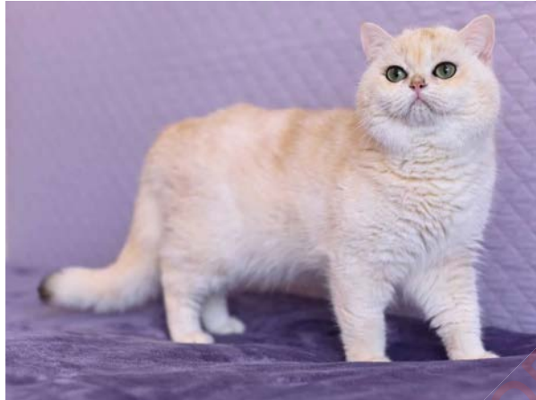
Figure 15. British shorthair black"sunshine" de type "pink-sunshine"

British. Les British "sunshine" peuvent présenter différentes nuances de couleur, allant d'un copper très clair (pink-sunshine, Figure 15) à un aspect silver shaded (silver-type sunshine, Figure 16), sans qu'aucun des deux parents ne soit silver. Le mode de transmission et le gène en cause sont inconnus à ce jour.