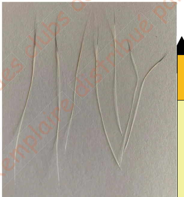
Figure 14. Photo et schéma de poils copper

La truffe est rose, avec une perte du liseré eumélanique (Figure 13). La base du poil est très claire, jaune pâle, et les poils présentent une bande de phéomélanine allongée et une pointe d'eumélanine, caractéristique des poils tipped (Figure 14).